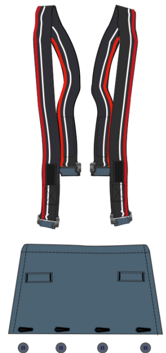
Abbildung 5: Mit Knöpfen zu befestigender Latz

Reflexmaterial: 3M ScotchLite segmentiert