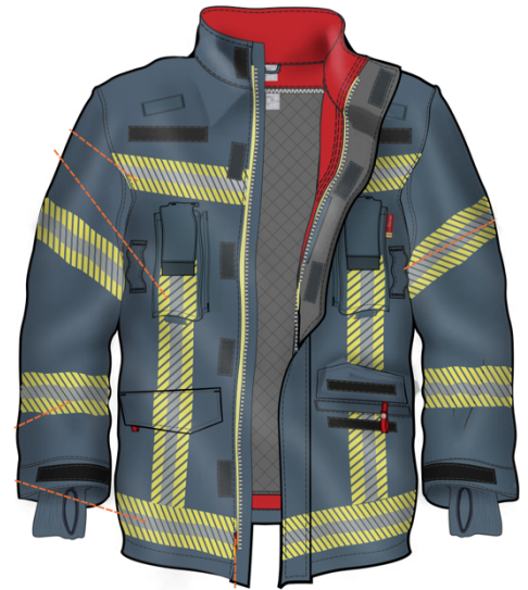
Abbildung 1: Frontansicht Jacke