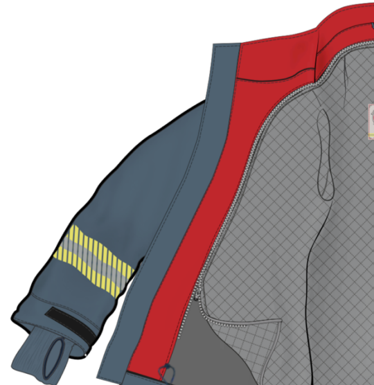
Abbildung 2: Herausnehmbares Winterfutter. Die Strickbündchen sind mit dem Winterfutter vernäht. Die Außenjacke besitzt keine Bündchen, sondern Daumenschlaufen